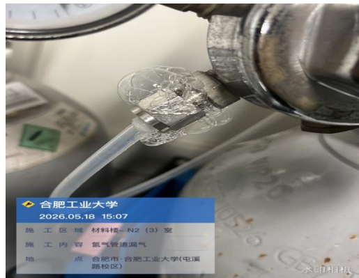
氩气、氢气、二氧化碳漏气